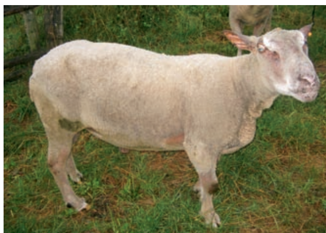
Bélier trop maigre à la mise en lutte.

Souvent négligée, l'alimentation des béliers a pourtant des répercussions directes à la fois sur la fertilité et la prolificité des brebis. Les béliers peuvent être comparés à des athlètes : ils ne doivent être ni trop gras, ni trop maigres pour saillir un maximum de brebis. La période de flushing commence deux mois avant la lutte car il faut 60 jours pour fabriquer un spermatozoïde. Un bon bélier maigrit toujours pendant les luttes, en bergerie comme à l'herbe.