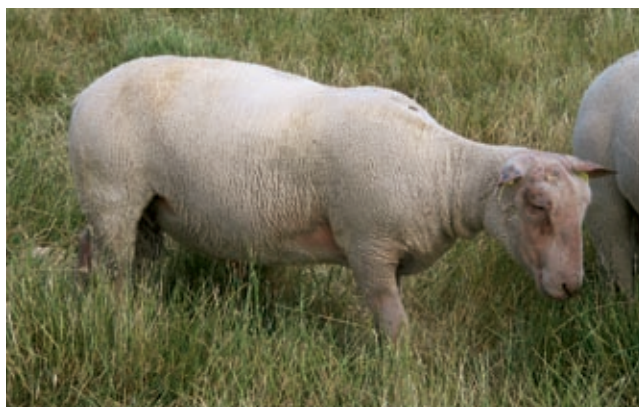
Bélier en bon état à la mise en lutte.